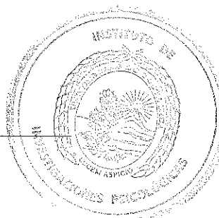
Firma Dirección, IIP

C:\TRABAJO\Consejo Científico\CC-2019 CC-111-2019.doc